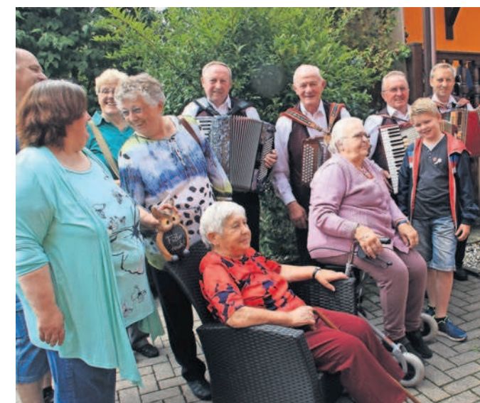
Geselligkeit war Trumpf auf dem ersten Sommerfest im Haus Eulennest.

Erst um 2 Uhr in der Nacht kehrte dann langsam Ruhe ein und am nächsten Morgen fiel es einigen Kindern sichtlich schwer, wieder munter zu werden.