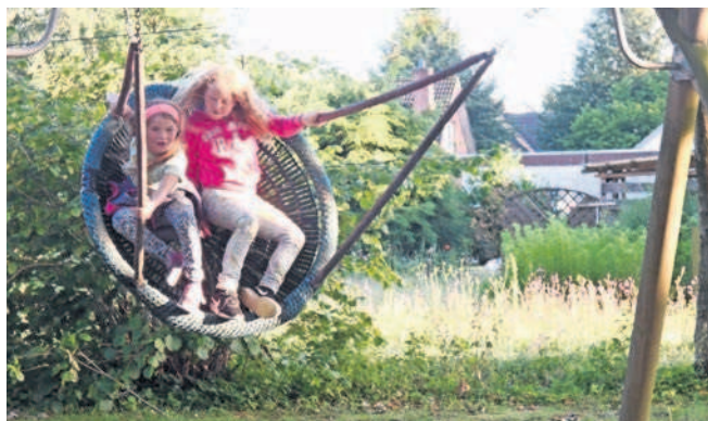
Die Kinder hatten ihren Spaß bei der Ferienstpaßaktion der SPD.

Ganz leise war es, als Silvia Wenau beim Flackern des Feuers die Geschichte von Peter und dem Wolf vorlas. Und dann beim Verlassen des Heimathauses war die